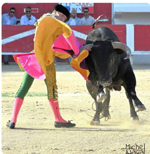
Clemente, magistral !